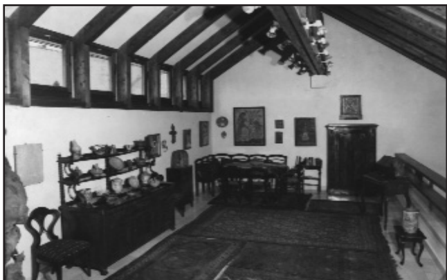
SZENTENDRE -- Kovács Margit Múzeum