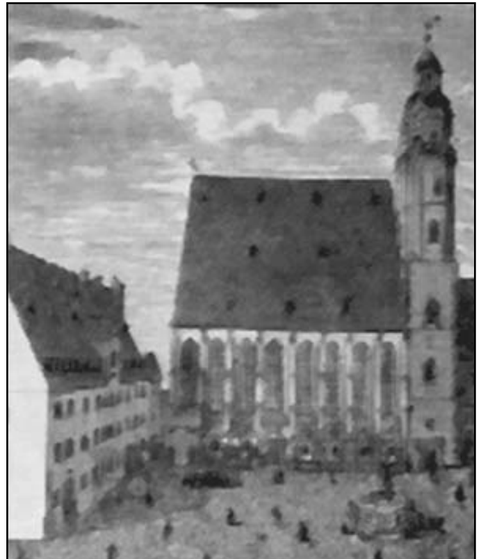
A Szent Tamás -iskola és -templom Lipcsében. Bach itt élt és dolgozott élete utolsó 27 évében.

Amikor megüresedik a lipcsei Tamás templom karnagyi állása, megpályázza azt. 1723. május 13-án iktatják be új tisztségébe. Itt sokasodik meg csak igazán a munkája. Minden vasárnapra új kantátát írni, betanítani, a város négy templomának istentiszteletén a zenét szolgáltatni. Emellett - szerződése szerint - heti tizenhat óra latint tanítani.