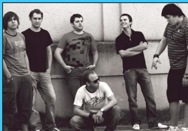
A pozsonyi Vždy a všade nevű szlovák zenekar