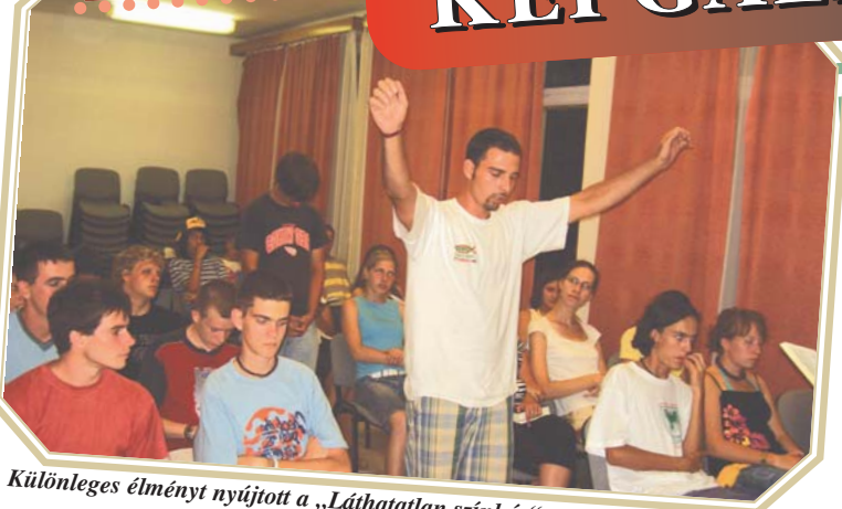
Különleges élményt nyújtott a „Láthatatlan színház“