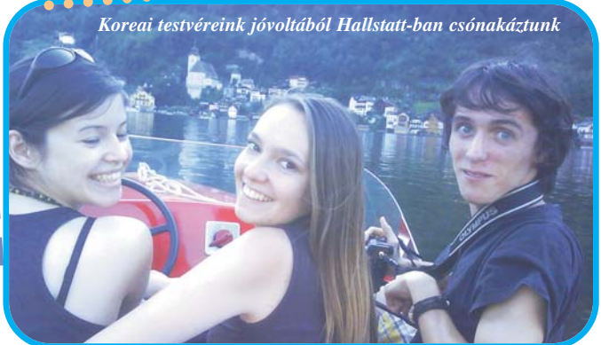
Koreai testvéreink jóvoltából Hallstatt-ban csónakáztunk