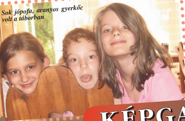
Sok jópofa, aranyos gyerkőc volt a táborban