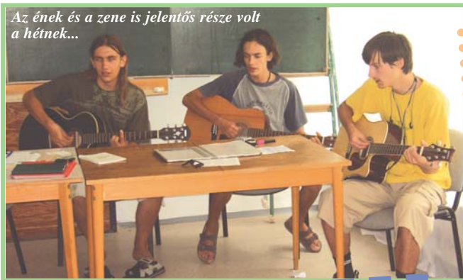
Az ének és a zene is jelentős része volt a hétnek...