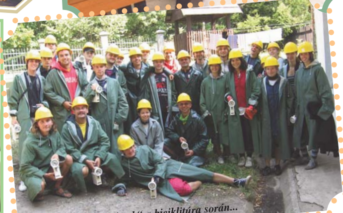
Selmeci „bányarédek“ a biciklitúra során...