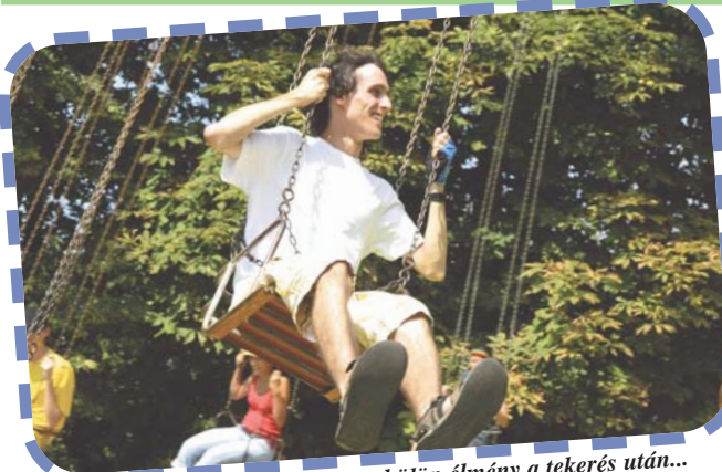
A körhinta külön élmény a tekerés után...