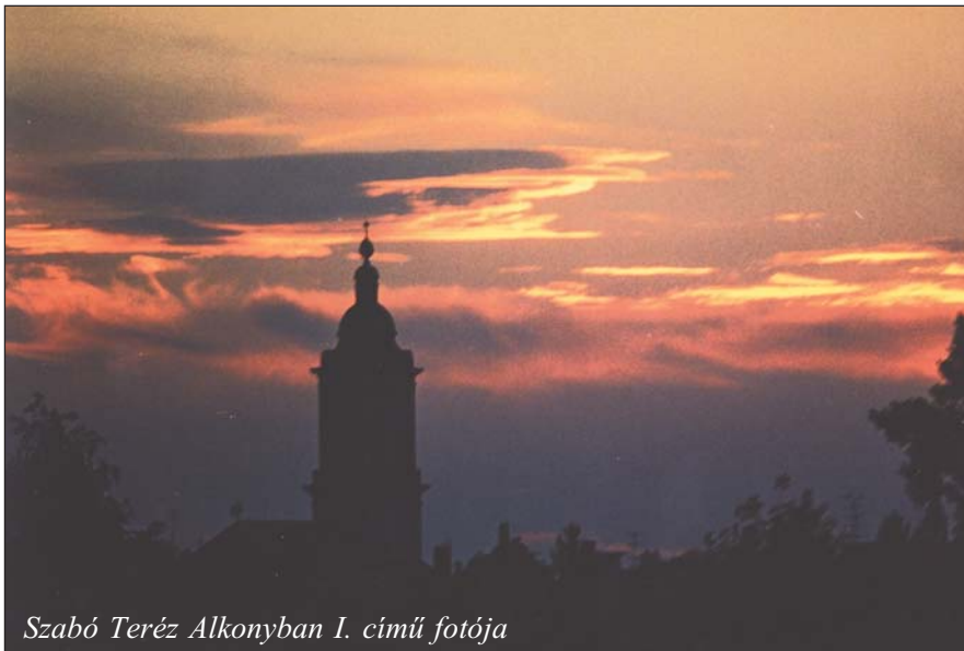
Szabó Teréz Alkonyban I. című fotója

„Minden, amit nékem ad az Atya, én hozzám jő; és azt, aki hozzám jő, semmiképen ki nem vetem. Mert azért szállottam le a mennyből, hogy ne a magam akaratát cselekedjem, hanem annak akaratát, aki elküldött engem. Az pedig az Atyának akaratát, aki elküldött engem, hogy amit nékem adott, abból semmit el ne veszítsek, hanem feltámasszam azt az utolsó napon. Az pedig annak az akaratát, aki elküldött engem, hogy mindaz, aki látja a Fiút és hisz ő benne, örök élete legyen; és én feltámasszam azt az utolsó napon.”