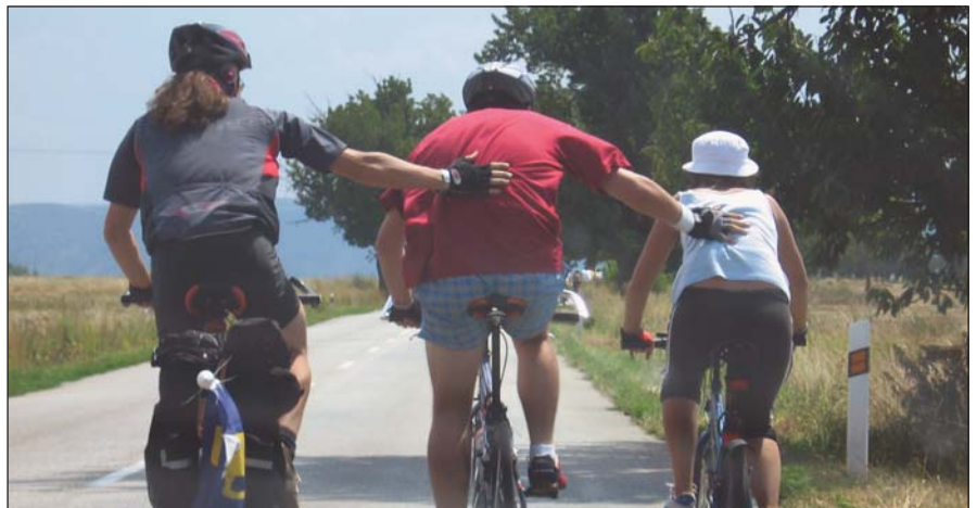
Ha nem megy, segítsük egymást 😊