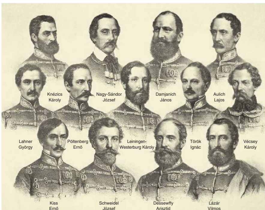
Ők mindannyian értünk haltak meg, ott az aradi sáncok alatt.

Kossuth Lajos eredeti hangjának fonográf-felvétele, amely 1890. október 20-án készült Torinóban.