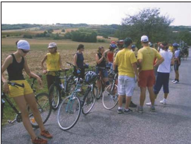
Útszéli pihenő a biciklitúrán...

A találkozó alkalmával nemcsak közös istentiszteleteket tartottunk, hanem megbeszélés folyt a kapcsolattartás további lehetőségeiről is. Örömmel várjuk a folytatást.